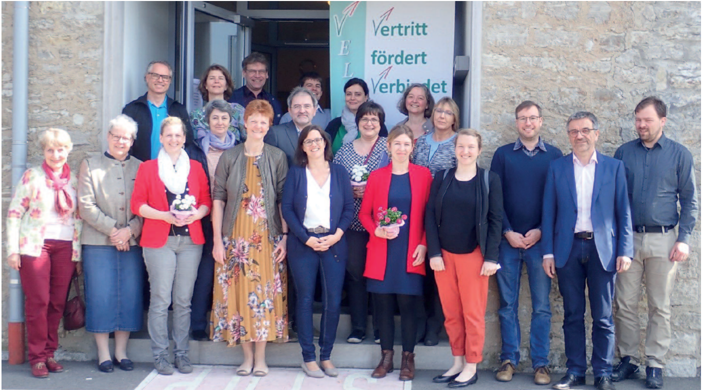
VELA-Geschäftsausschuss Frühjahr 2019 in Schwarzenau

Der zweitägige Geschäftsausschuss tagte am 29. und 30. März. Im Lehr-, Versuchs- und Fachzentrum Schwarzenau trafen sich die Bezirksvorstände, die Gruppenvertreter und der Landesvorstand.