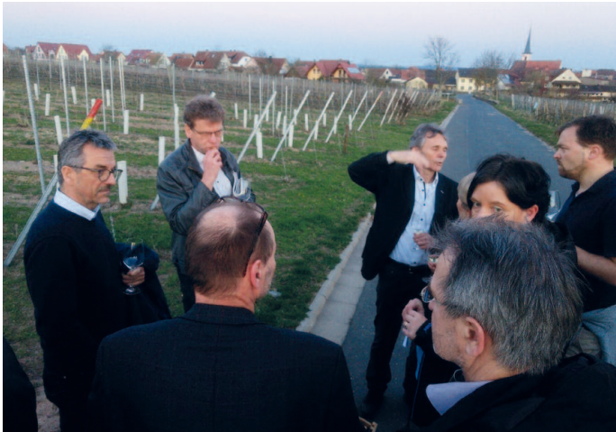
Führung im Weinberg