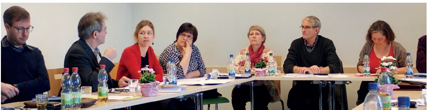
Intensiver Austausch im Geschäftsausschuss