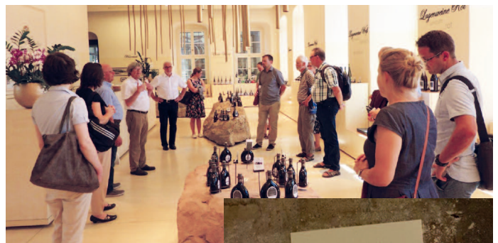
Die Teilnehmer informierten sich am Nachmittag zur Geschichte des Staatlichen Hofkellers in Würzburg und besichtigten unter anderem den „Beamtenkeller“

Im Anschluss nutzten die Teilnehmer und Teilnehmerinnen die Mittagspause in der Kantine der Regierung, um sich mit aktiven und ehemaligen Kollegen auszutauschen. Am Nachmittag stand ein Besuch der Vinothek und des Staatlichen Hofkellers Würzburg auf dem Programm. Als eines der größten Weingüter Deutschlands blickt es auf eine über 885 Jahre alte Geschichte zurück, seit 1918 ist der Hofkeller selbständiges bayerisches Staatsweingut. In einer unterhaltsamen Führung durch die historischen Keller ging es unter anderem in den Bacchuskeller und den Beamtenkeller mit vielen interessanten Geschichten und einer kleinen Kostprobe. Danach klang die Veranstaltung aus.