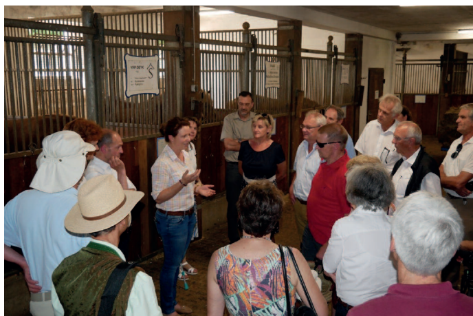
Blick in den Stall