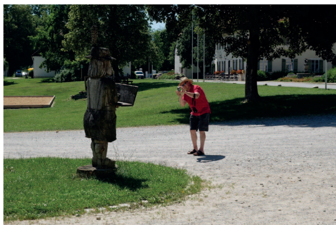
Impressionen aus Schwaiganger