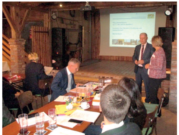
Regierung von Niederbayern, Ltd. LD Werner Eberl

Tatsache: Die Landwirtschaft ist an den Regierungen wieder präsent. Das frühzeitige und gleichberechtigte Wahrnehmen der Belange des Geschäftsbereichs bietet sehr große Vorteile.