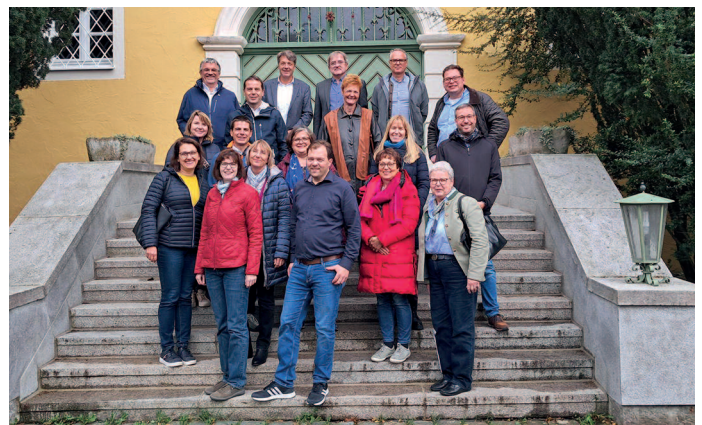
Gruppenbild des Geschäftsausschusses (Herbst-GAS 2024)