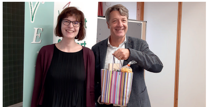
Geschenkübergabe an den Referenten

Nach herzhaftem Rinderbraten und letzten Gesprächen ging es diesmal vor allem in Richtung Süden und Westen nach Hause.