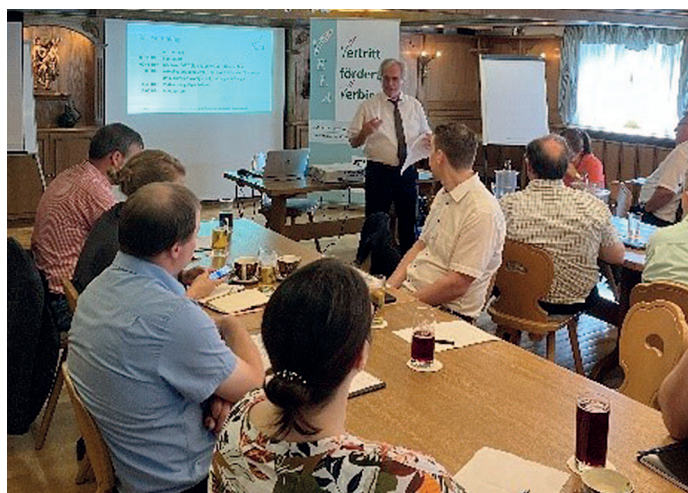
Vortrag