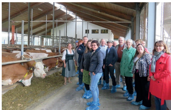
Stallführung bei der VELA-Bezirksversammlung in Niederbayern