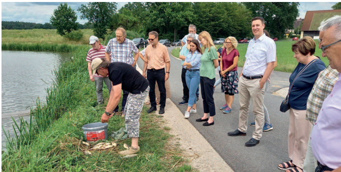
Am Karpfenteich