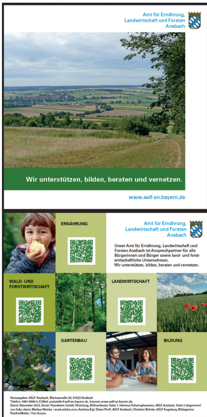
Screenshots des Imageflyers

Auf der VELA-Jahresversammlung wurde angesprochen, dass im sogenannten „Amtsflyer“ keine Angaben zum Tätigkeitsbereich Ernährung enthalten sind. Der Flyer „Zahlen und Fakten Land- und Forstwirtschaft im Dienstgebiet“ gibt dem Titel entsprechend einen Überblick zur Flächennutzung, Tierzahlen, etc.