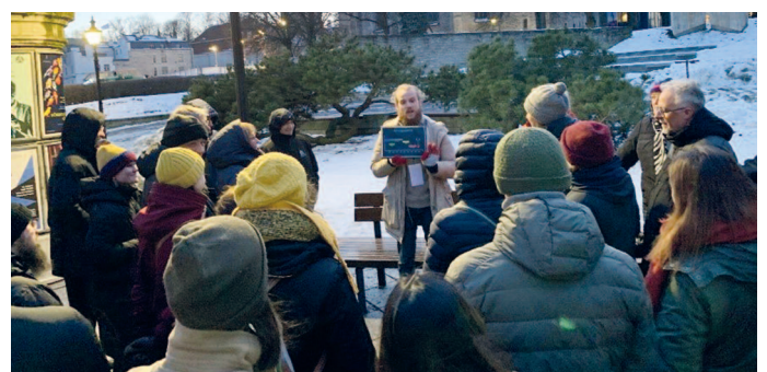
Bild VELA: Als Kulturprogramm gab es eine historische Stadtführung in Tallin am späten Abend