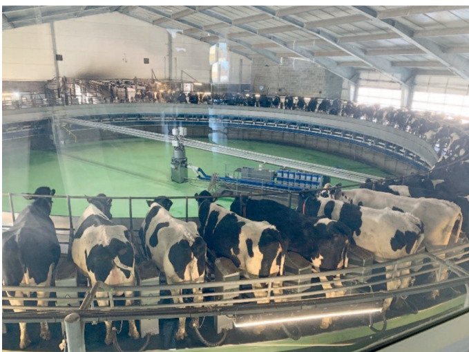
Bild VELA: Estland hat die höchste Milchleistung in Europa. EUFRAS besucht den größten Milchviehbetrieb Väätsa Agro mit etwa 3.000 Milchkühen. Das Karussell hat 80 Plätze. Gemolken wird in zwei 11-Stunden-Schichten