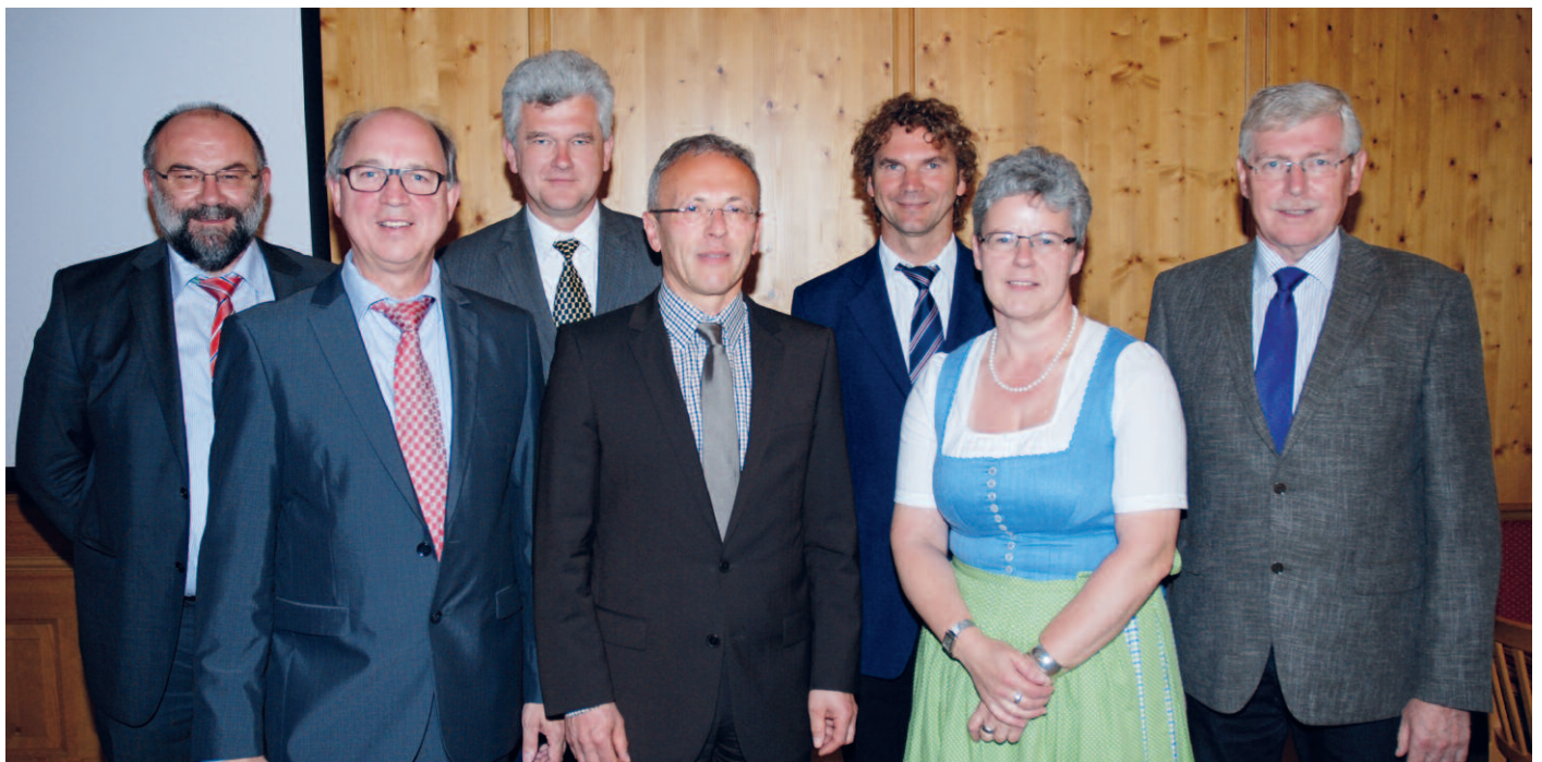
Alter und neuer Vorstand